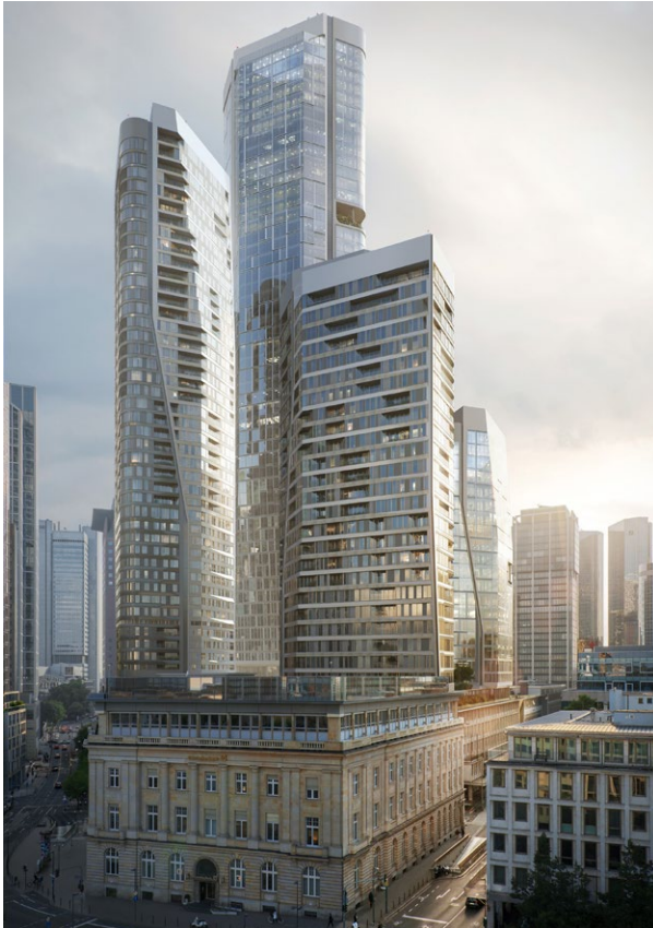
Die Räume der Kanzlei Baker McKenzie befinden sich im FOUR Frankfurt.